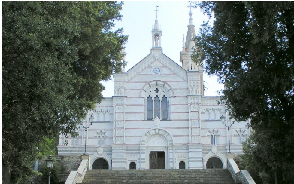
Gli ultimi gradini per arrivare al Santuario di Nostra Signora di Montallegro

Per informazioni è possibile contattare il capo gita, preferibilmente con e-mail.