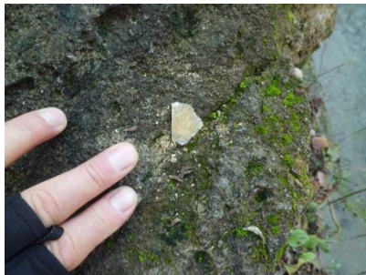
Frammenti di conchiglie fossili Chiesa di San Nicomede