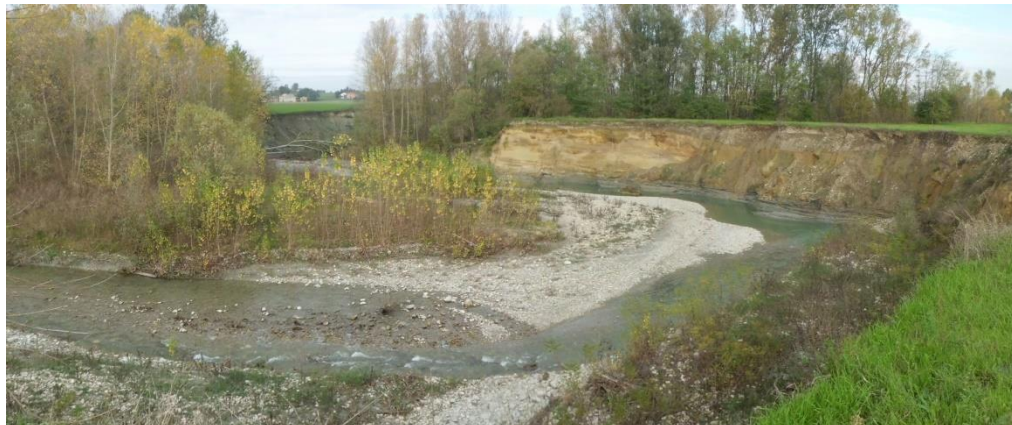
Ansa dei Guccioni