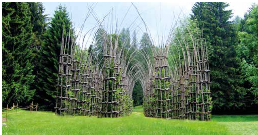
Giuliano Mauri, Cattedrale vegetale

Alla base di questa realizzazione ci sono i principi della Land Art , un movimento artistico nato nella seconda metà degli anni '60, che ha avuto uno straordinario sviluppo soprattutto dal decennio successivo. Si fonda sul principio di interazione tra artista e natura, considerata ora come un supporto su cui intervenire, ora come coautrice delle opere: la Land Art afferma l'idea che gli interven-