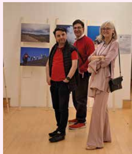
visitatori alla mostra