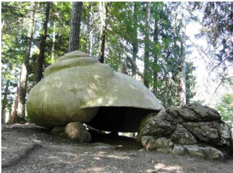
Alfio Bonanno, La chiocciola

L'installazione più nota, e fra le prime ad essere realizzate, è la Cattedrale Vegetale dell'artista Giuliano Mauri. Ottanta strutture in legno di dodici metri sono state piantate con una disposizione che richiama le colonne di una cattedrale gotica di tre navate. Al loro interno 80 carpini nel tempo sono cresciuti e "la cattedrale" si è via via modificata.