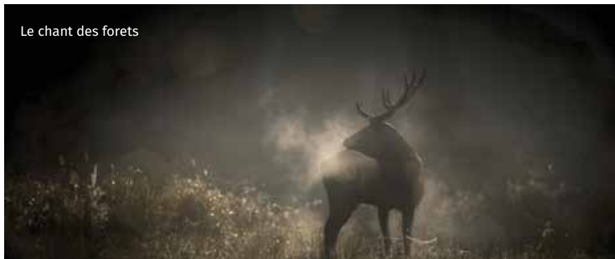
Le chant des forêts

Il Gran Premio Città di Trento e Genziana d'oro è stato vinto da "Le chant des forêts" del francese Vincent Munier. Un film sicuramente poetico, girato nei boschi dei Vosgi che riprende la vita di tanta fauna e dove i protagonisti delle riprese sono tre generazioni di appassionati osservatori della natura. Il film indugia soprattutto sul bel rapporto nonno-nipote, premessa per una nuova generazione sensibile e rispettosa della natura in tutte le sue forme. Tanta la fauna ripresa con delicatezza nel suo ambiente (gufi, scoiattoli, cinghiali, caprioli, picchi, cervi, ecc) con una attenzione particolare al gallo cedrone, anche se per riprenderlo, vista la sua assenza nei Vosgi, il regista fa riprese in Norvegia, non sapendo che a Trento in passato (anni Settanta) ammirammo già un