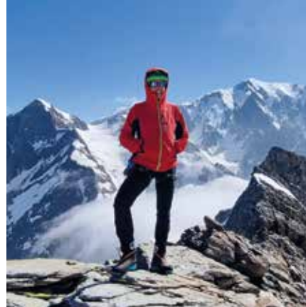
Vista sul ghiacciaio des Conscrits

il tratto finale di via verso la vetta. Alle ore 9:00 circa siamo sulla cima del Monte Bianco. Le cordate si sono mancate per poco, benché ci fossimo tenuti costantemente in contatto via radio, ma non si può neanche rimanere a lungo sulla vetta, esposti ai venti persistenti. Foto di rito e si prosegue in discesa lungo la Via dei 3 Monti. Come accennato il percorso non si è rivelato semplice e ci ha costretti a numerosi rallentamenti nei punti di imbottigliamento delle cordate con passaggi obbligati perché unici ponti di neve aperti o presenza di corda fissa. Ciò nonostante, dissolto ogni pericolo di temporale ed essendo in anticipo sulla tabella di marcia, possiamo dire che la discesa fino agli impianti dell'Aiguille du Midi sia stata al termine più rilassata dal previsto. Una volta raggiunta la nostra meta, guardandoci indietro, siamo rimasti come impietriti ad ammirare quest'ultima parte dell'impresa compiuta, senza avere la minima voglia di scendere da madre ghiaccio; però le avventure sono belle anche perché finiscono e si possono raccontare, in attesa di compierne di nuove, quindi voltate le spalle alla Signora, siamo tronati nella calda valle per una lauta cena e confortevole riposo.