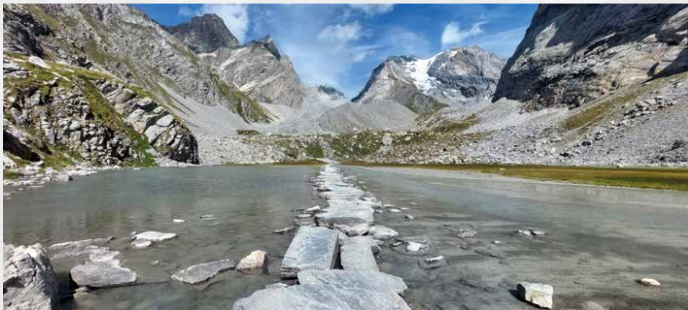
Camminando sulle acque del Lac des Vaches

Sempre nel sole brillante delle vette seguiamo il nostro anello per i giorni successivi. Ogni tanto dietro una svolta o un colle giochiamo a indovinare una montagna lontana. Les Ecrins! La Dent Parrachée! E mille altre mon-