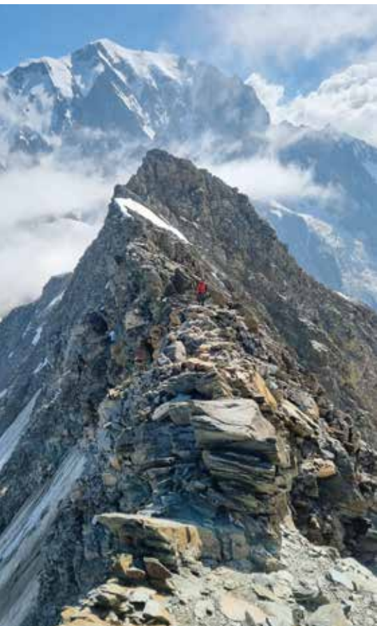
Cresta dei Dome - roccia

co costituito da due pentole saldate, ci vogliono una tenacia e dedizione marmoree.