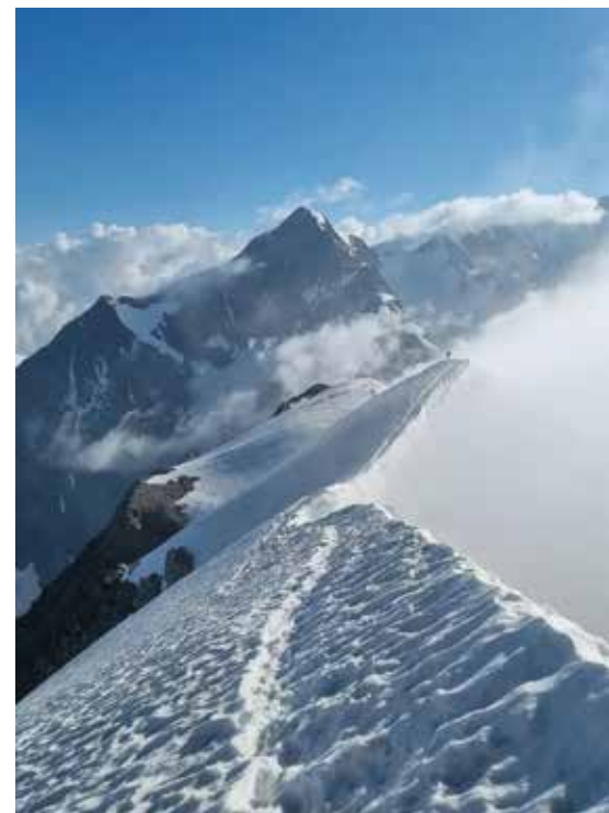
Cresta dei Dome - neve

Il primo giorno, raggiunto il versante francese del Monte Bianco e parcheggiata l'auto, si inizia a camminare con temperature elevate, consapevoli che i giorni seguenti quel caldo sarà solo un ricordo; gradualmente si attraversano boschi, pendii granitici lavorati da un vecchio ed instancabilissimo artigiano, l'acqua, fino ad affacciarsi sul ghiacciaio dei Dome. La salita deve avvenire con passo costante e non forzato al fine di acclimatarsi al meglio e scaldare le gambe.