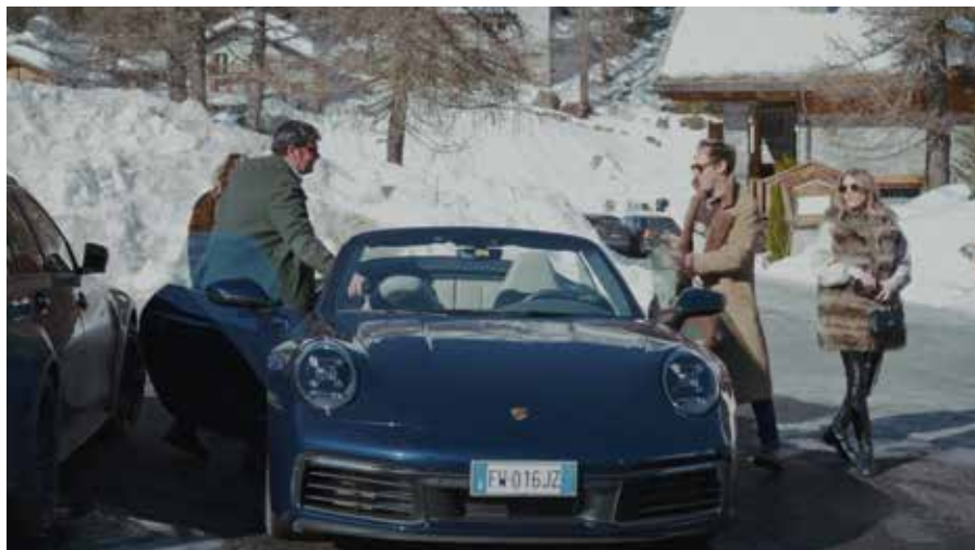
Courma e Courmayeur