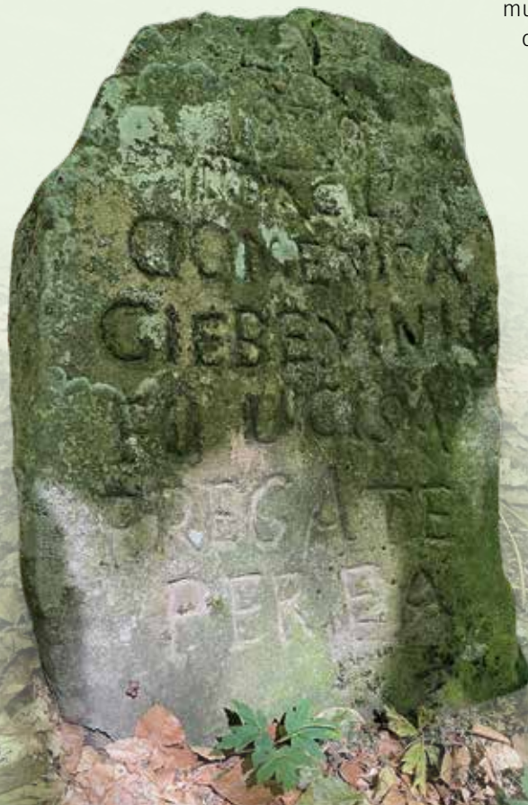
Il masso con l'incisione