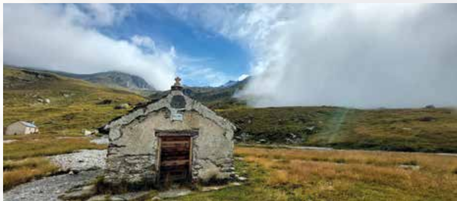
Chiesetta nel fondovalle

tagne. Le sorgenti non mancano e presto smettiamo di utilizzare il filtro depuratore, beviamo direttamente l'acqua ghiacciata dei ruscelli in attesa delle meritate birre ai rifugi.