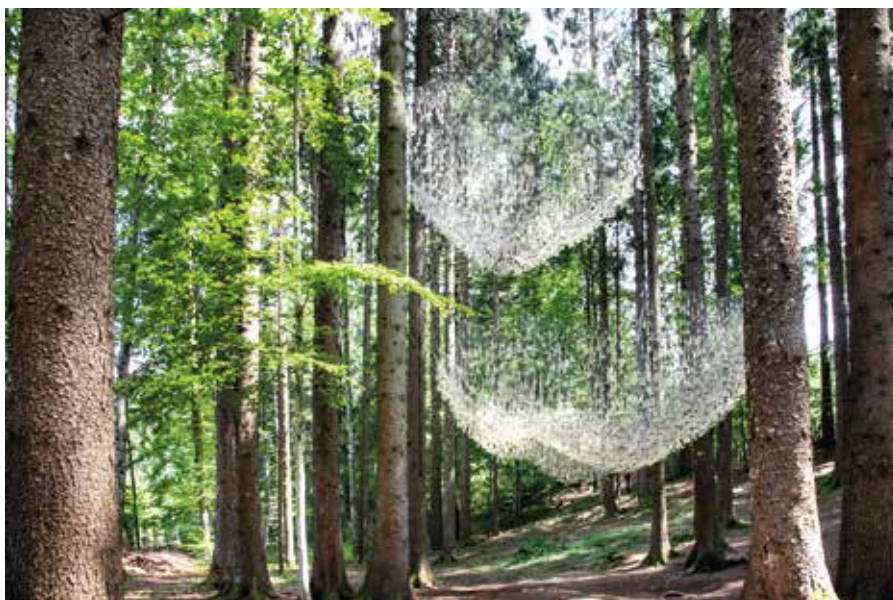
John Grade, Réservoir (Ascesa)

Si diceva che le creazioni di Arte Sella sono soggette ai mutamenti della natura: nell'ottobre 2018 anche questi luoghi sono stati duramente colpiti dalla tempesta Vaia, ma la forza d'animo trentina si è subito messa in moto ripristinando le opere.